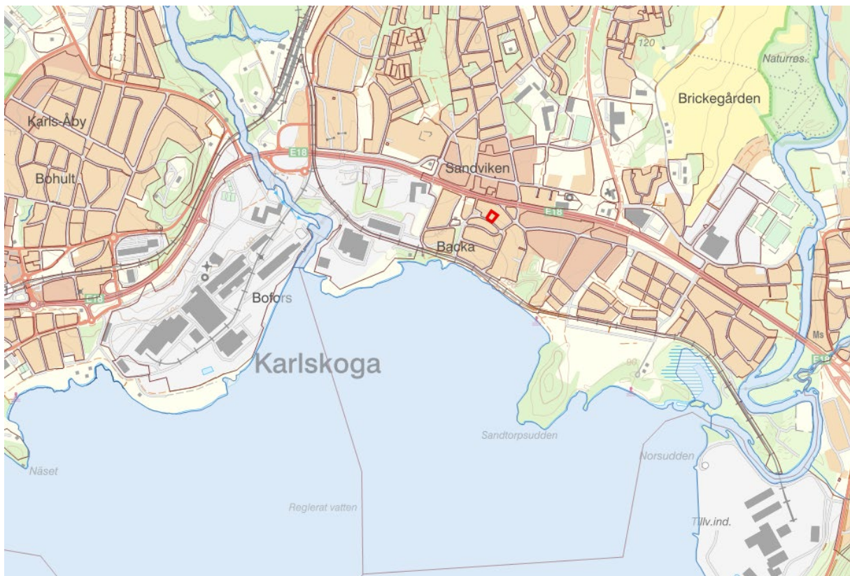
Figur 1 Lokalisering karta

Ändringsområdet består av en privatägd fastighet, Saxfiskan 8 , i sydöstra delen av Karlskoga tätort. Ändringsområdet avgränsas därmed av fastighetsgränsen i fråga, som ligger i direkt anslutning till Mellanvägen, samt strax söder om Örebrovägen (E18). Fastigheten Saxfiskan 8 är privatägd. Kringliggande bostadsfastigheter är privatägda. Gatunätet är kommunens mark.