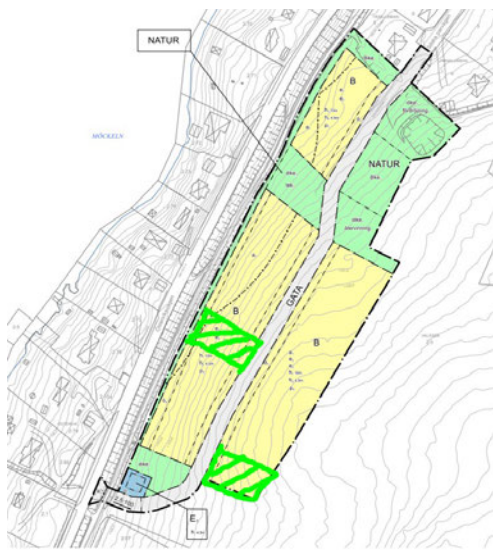
Figur 1. Två markerade områden att leda vatten förbi kvartersmarken när behovet uppstår.

Lösningar på vattenproblematiken längre söder ut i detaljplanen är inte hanterat tillräcklig omfattning. Med tanke på dagvattnets karta över var och hur vattnet rör sig ner i området är det viktigt att spara en möjlighet att hantera dagvatten även söder ut i planområdet. I dagsläget saknas detta vilket inte lämnar några möjligheter att arbeta med framtida skyfallsproblem. Vi föreslår därför att ha ett släpp av natur genom den gula kvartersmarken (figur 1). Dessutom behöver dagvattenlösningarna dimensioneras utifrån 50-årsregn snarare än 10-årsregn som det är gjort nu. Detta pga den utveckling vi redan ser med att "10-årsregn" kommer mycket oftare nu för tiden.