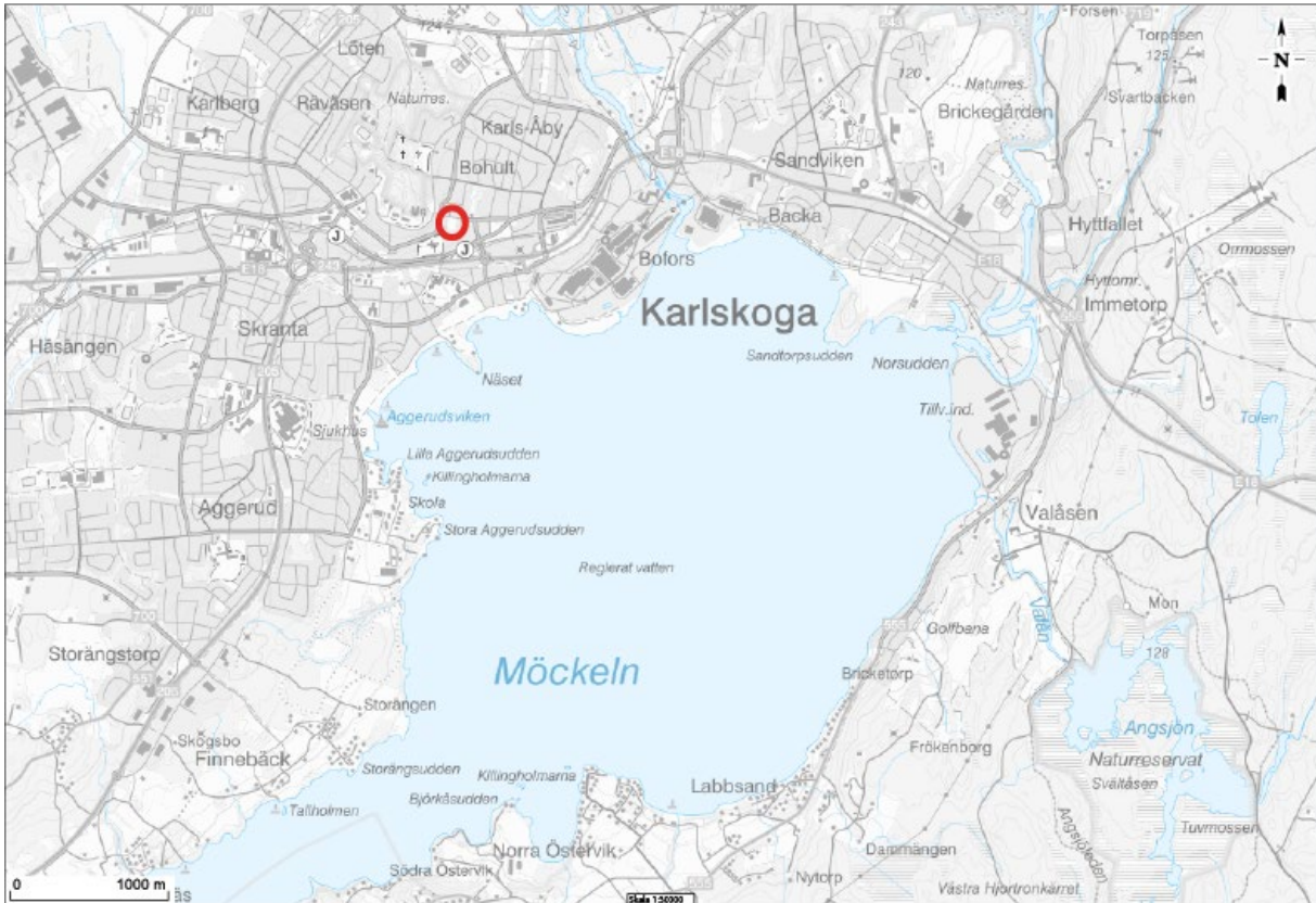
Figur 1 Lokalisering karta

Ändringsområdet är beläget i Karlskogas centrum, cirka 600 meter från Karlskoga busstation.